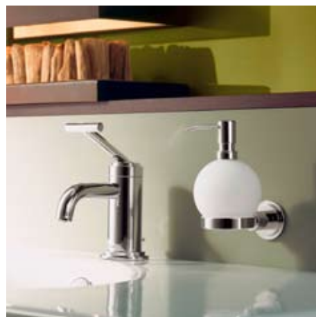
JADO New Haven