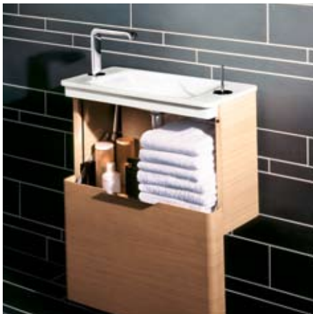
JADO Glance Welcome