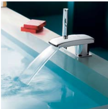
JADO Jean Nouvel

Puristische Formen und ein ausgeprägt technisches Innenleben sind charakteristisch für die Produkte in der Kategorie Think JADO. Die innovative Badkollektion des weltberühmten französischen Architekten Jean Nouvel ist ein perfektes Beispiel für diese Philosophie: Das integrierte digitale Sensorsystem regelt perfekt Temperatur und Wassermenge. Mit dieser Technologie und ihrem konsequent organischen Look repräsentiert die Kollektion JADO Jean Nouvel das Bad der Zukunft. Zu Think JADO gehören darüber hinaus die vielfach mit Designpreisen ausgezeichnete Armaturenserie Glance von ARTEFAKT und Glance Welcome, das ebenfalls von dem Darmstädter Designerteam entworfene Waschplatzkonzept für das Gästebad sowie die ganz dem rationalen Kubismus verpflichtete Badlinie JADO Cubic von Friis & Moltke Design, bedeutenden Impulsgebern in der dänischen Architekturszene.