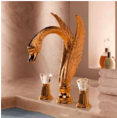
JADO Perland Cristal

Verspielte, romantische Formen, die Stilelemente vergangener Epochen aufgreifen und modern interpretieren sind charakteristisch für die Kollektionen im Bereich Dream JADO. Die Kollektion JADO Retro ist eine nostalgische Reminiszenz an die Zeit des Art déco, JADO Lighthouse verleiht dem Bad maritimes Flair und der opulente, warme Stil von JADO Oriental macht das Bad zu einem Ort, an dem man in seine Träume eintauchen und sich entspannen kann. Den puren Luxus verkörpert die Kollektion JADO Perland Cristal mit der extravaganten Armatur in Gestalt eines Schwans und Kristallgriffen von Swarovski.