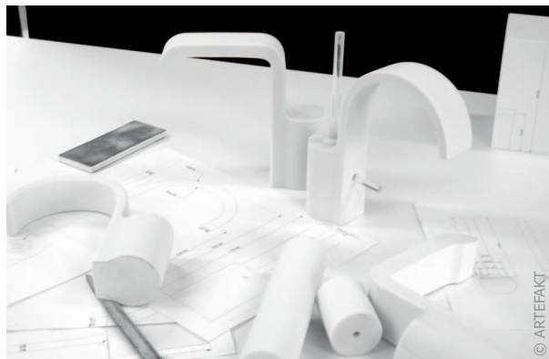
Sowohl rund als auch eckig: JADO Glance