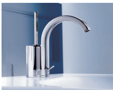
JADO Glance: Die gebändigte Kraft des Wassers

Ein Klassiker des modernen Baddesigns im Porträt