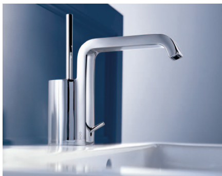
Eckig auf die sanfte Art

Achim Pohl: Rund oder eckig, das war für uns die Frage. Das obere Preissegment polarisiert in die Lager progressiv-trendig und modern-wohnlich. Wir