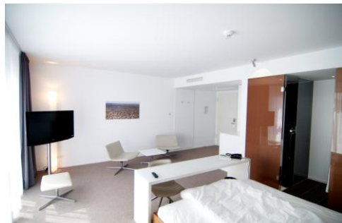
Die Gästezimmer zeichnen sich durch einen ganzheitlichen Entwurf aus. Bad und Schlafzimmer gehen fließend ineinander über.

Das Hotel ist dank einer direkten Anbindung zum Flughafen besonders für Businessgäste, Meetings und Events prädestiniert. Die fünf modernen und stilistisch außergewöhnlichen Konferenzräume eignen sich perfekt für geschäftliche Tagungen oder Events: Die Räumlichkeiten nehmen eine Gesamtfläche von 375 Quadratmetern ein, sind jeweils 3,80 Meter hoch, lichtdurchflutet und klimatisiert sowie mit hochwertigem Design-Interieur ausgestattet – hinzu kommt ein einzigartiger Innenhof. 80 Tiefgaragenplätze und der kostenlose Shuttle-Service zum nahe gelegenen Flughafen garantieren freie Mobilität für alle Gäste.