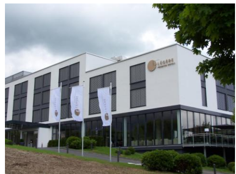
Das exklusive Lifestyle Légère Premium Hotel in Munsbach, Luxemburg.

In Munsbach, nur wenige Autominuten von der Stadt Luxemburg und den Messehallen der Luxexpo entfernt, hat Ende Mai 2010 das neue Vier Sterne Légère Premium Hotel Luxemburg eröffnet.