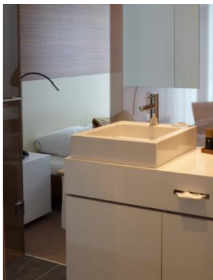
Die puristischen Design-Armaturen von JADO Geometry passen perfekt in architektonische Hotelbäder.

Suiten mit eigener Küchenzeile. Das Hotel arbeitet mit einem neuen architektonischen Konzept, das sich wohltuend von der standardisierten Hotelausstattung anderer Hotelketten absetzt: Die Gästezimmer sind ganzheitlich entworfen. Ein offenes Wohnbad mit Regendusche wird ergänzt durch King-Size Betten für maximalen Schlafkomfort. Business-Gästen bietet sich ein mobiler Arbeitsplatz für moderne Kommunikation inklusive DSL-Anschluss, WIFI sowie einer Docking Station für den i-pod.