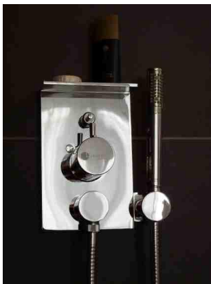
Die neue JADO Brause - Armatur wurde speziell für das Hotel Légère und damit für die Bedürfnisse der gehobenen Luxushotellerie entwickelt.

Industriedesign in den Niederlanden, ist eine Symbiose aus kantigen und abgerundeten Elementen. Die einzelnen Bausteine lassen sich individuell kombinieren und immer zu einem harmonischen Ganzen fügen.